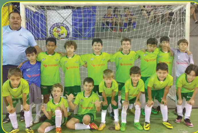
Alunos se esforçaram bastante para a vitória

Equipe goleou e se classificou para a próxima rodada da competição