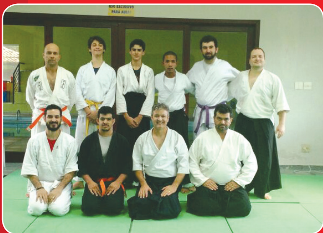
Atletas se prepararam para prova

Alunos passaram por avaliação e se prepararam para a troca de faixa