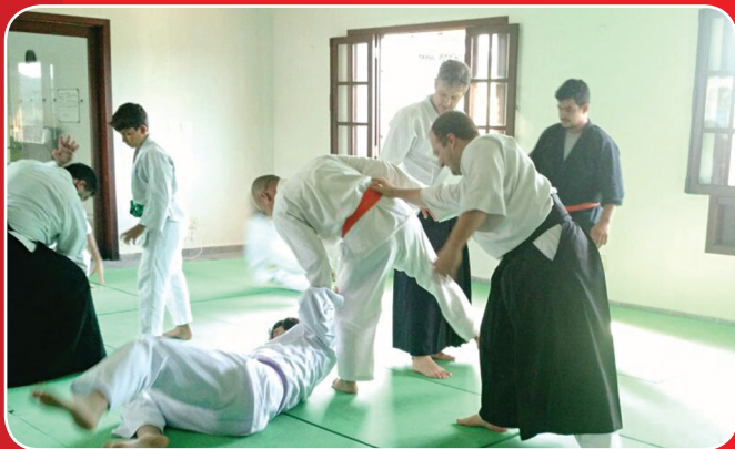
Técnicas foram avaliadas

No dia 7 de maio, cerca de 20 atletas, entre crianças e adultos, participaram do Seminário de Aikido. O evento teve como objetivo preparar os alunos do clube para o exame de troca de faixas. Durante o seminário, foi feita uma avaliação